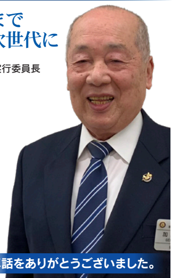
卓話をありがとうございました。