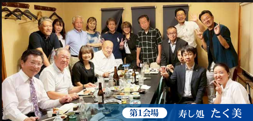
第1会場 寿し処 たく美