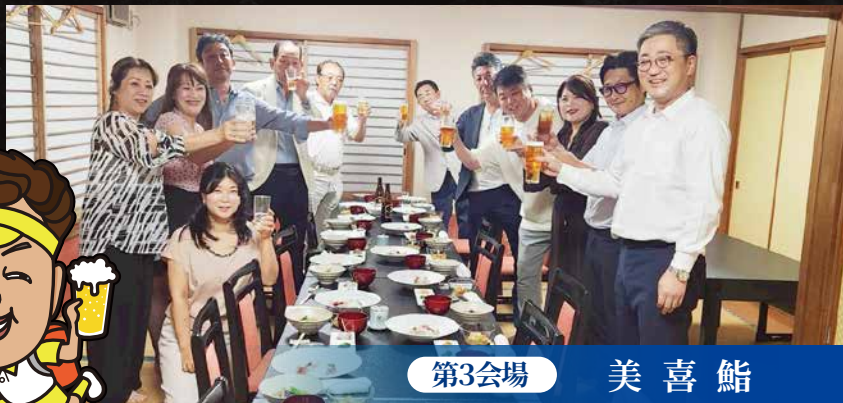
第3会場 美 喜 鮎